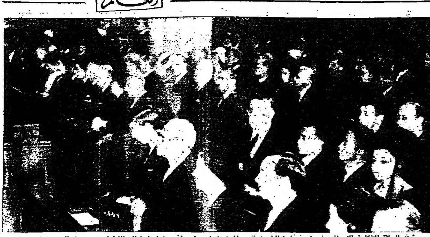
مخبر المصلاة المتخارية التي اقيمت في ملبورن باستراليا عن نفس المشاهير هوك رئيس وزراء استراليا الراحل...